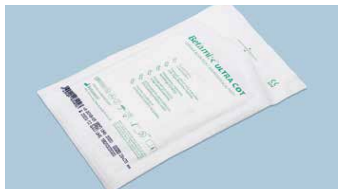
Busta sterile da 10 cottonini