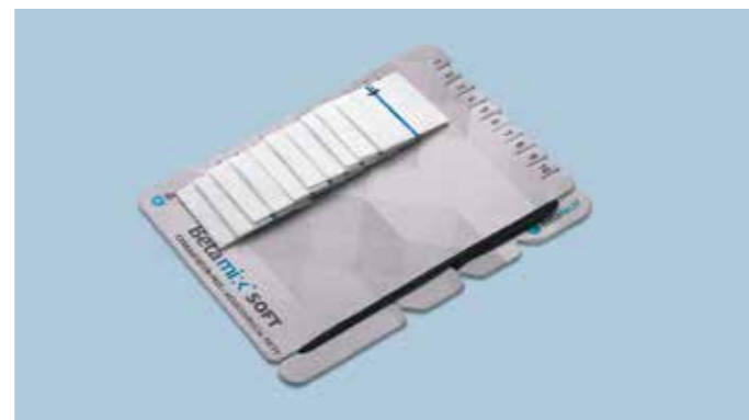
I cottonini sono forniti su un cartoncino dentellato per facilitarne il conteggio finale.