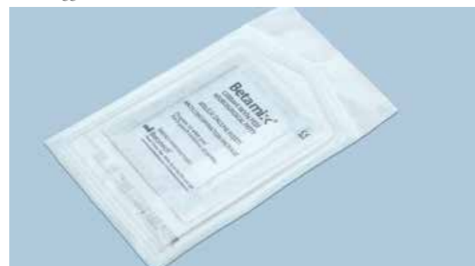
Confezionati in doppia busta sterile anticontaminazione. Garanzia di massima sicurezza.