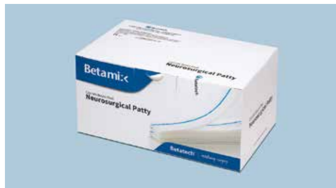
Confezione di vendita da 200 cottonini